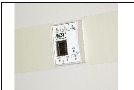
Einbau in einen 45mm Ausschnitt